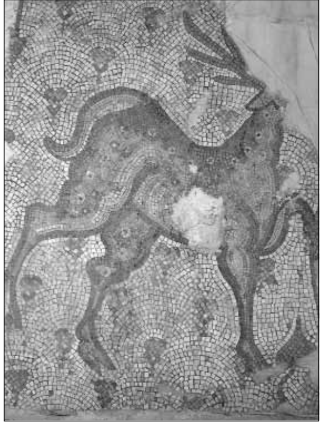
٨. لوحة فسيفسائية تمثل غزال مفقود الرأس.