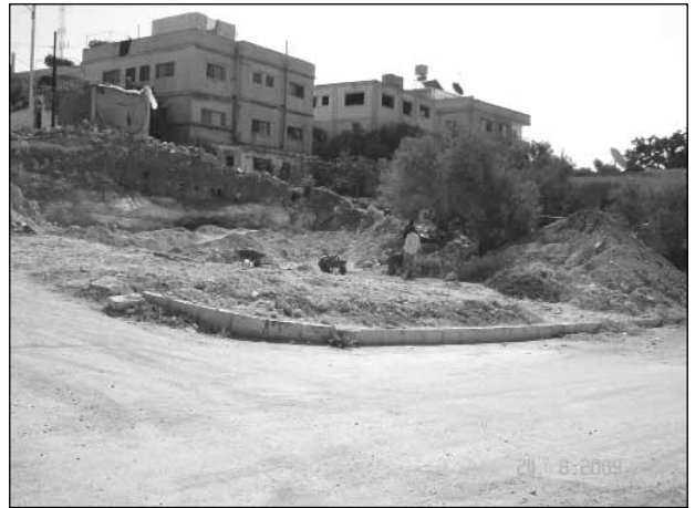
١. موقع حفريات سمر.