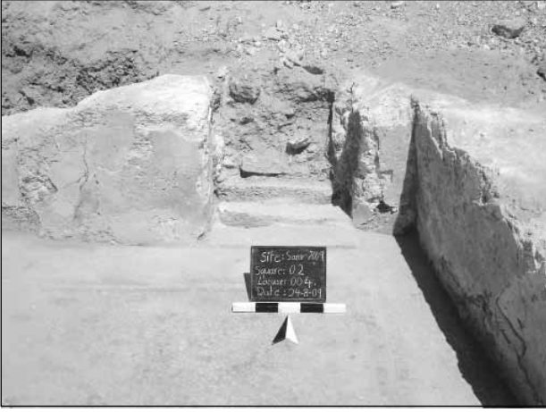
٤. مربع رقم (٢) بعد الانتهاء من العمل.