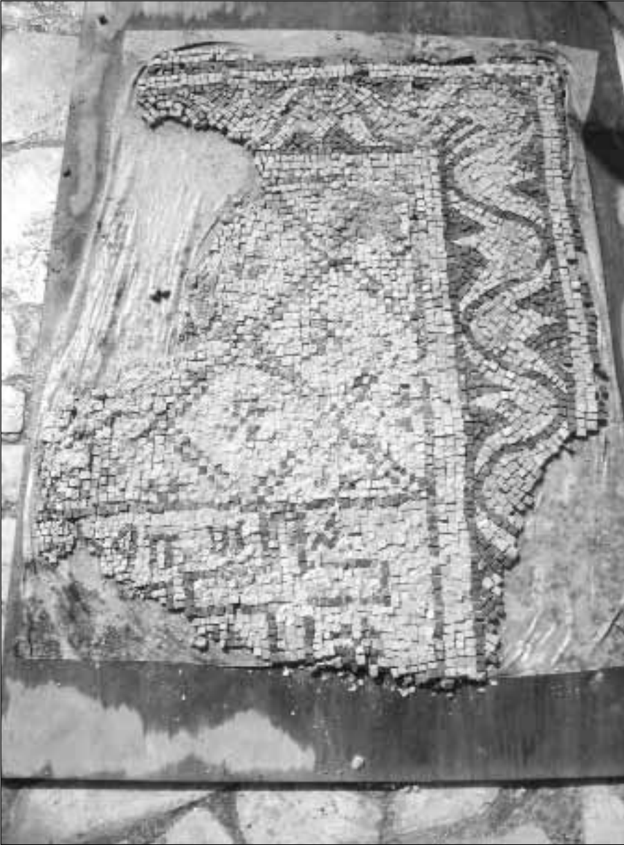
٥. جزء من الأرضية الفسيفسائية بعد عملية الخلع.