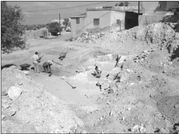
٢. منظر يظهر بداية العمل.

المربع رقم (٤): لوحظ في هذا المربع والمربعات المجاورة وجود