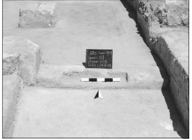
٣. مربع رقم (١) بعد انتهاء العمل.