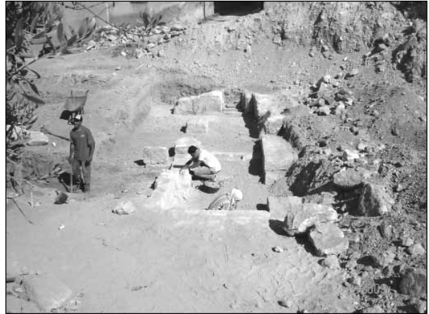
٦. مربع رقم (٤) أثناء العمل.

استخدم في البناء حجارة كلسية متوسط الحجم، تراوحت سماكة الجدران من ٦٠ سم إلى ٩٠ سم، واحتوت على مجموعه من الفتحات للأبواب والأعمدة وكانت كما يلي: ١. مدخل بوابه في الجهة الشمالية يحتوي على ثلاث درجات تتجه إلى الأعلى عرضها ٧٥ سم. ٢. عتبة حجرية بطول ١٦٥ سم وعرض ٨٥ سم تقع في منتصف المبنى، تفصل بين الممر والرواق.