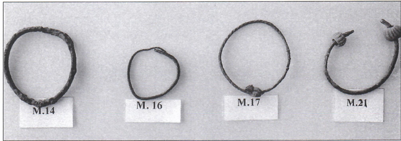
٧. مجموعة من الاساور البرونزية وخلخال برونزي.