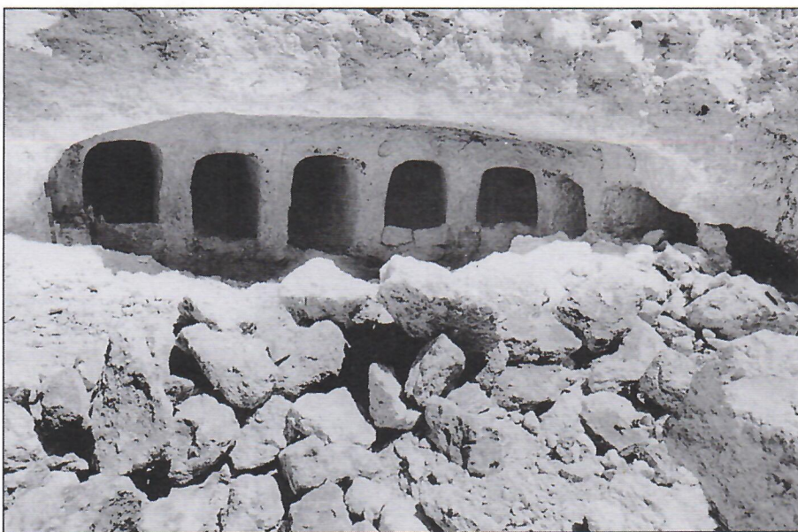
١. منظر عام للقبور مع التجريف.

كشفت خلال عمليات الحفر الدقيق يدويا على مدفن من الحجر الجيري ويتميز هذا النوع من الحجارة بسهولة القطع، وهو السبب الذي دعى أهل المنطقة لإختيار هذا الموقع لحفر مدافنهم في القطع الصخري. عثر بداخل هذا المدفن على ثمانية قبور منها ما هو مغلق بحجارة وطين بمستوى مدمالك أو مدماكين، أما الشكل الخارجي لهذه القبور عبارة عن حنايا قوسية مقطوعة في الصخر الجيري (الشكل ١)، بعضها كان يحتوي على هيكل عظمية مختلفة في حالة سيئة جداً، ولم يعثر فيها الا على بقايا جمجمة، ذلك نتيجة لإرتفاع نسبة