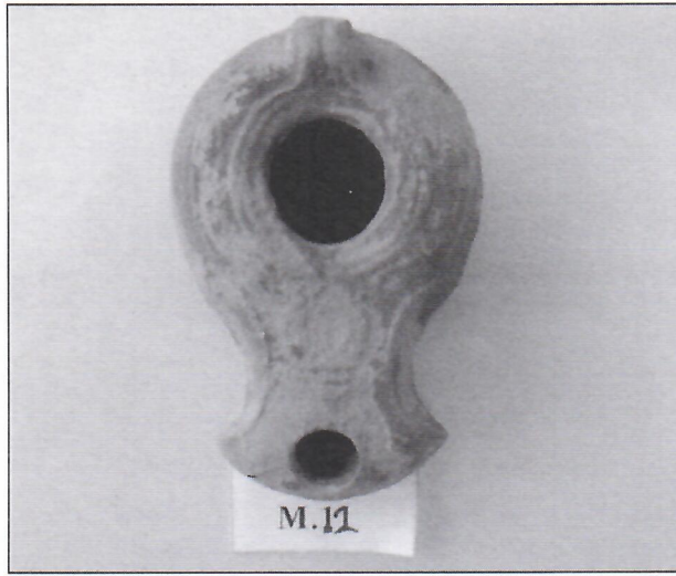
٦. سراج فخاري.