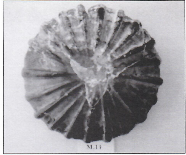
٥. زبدية من الزجاج.