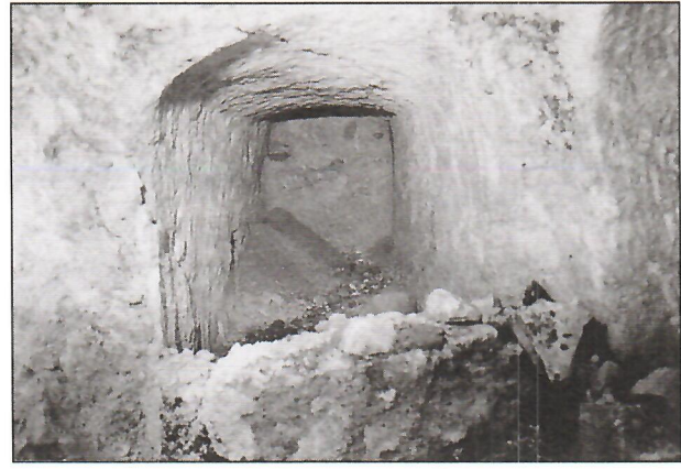
٢. الدمار الذي تعرضت له بعض القبور.

٦- بعض هذه القبور أعيد استخدامها مثل القبر M.T6 حيث عثر بداخله على بعض العظام مكومة بطريقة عشوائية في نهايته.