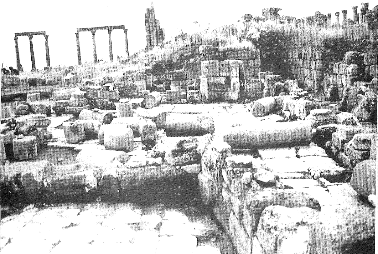
المسجد الاموي في جرش بعد التنقيب