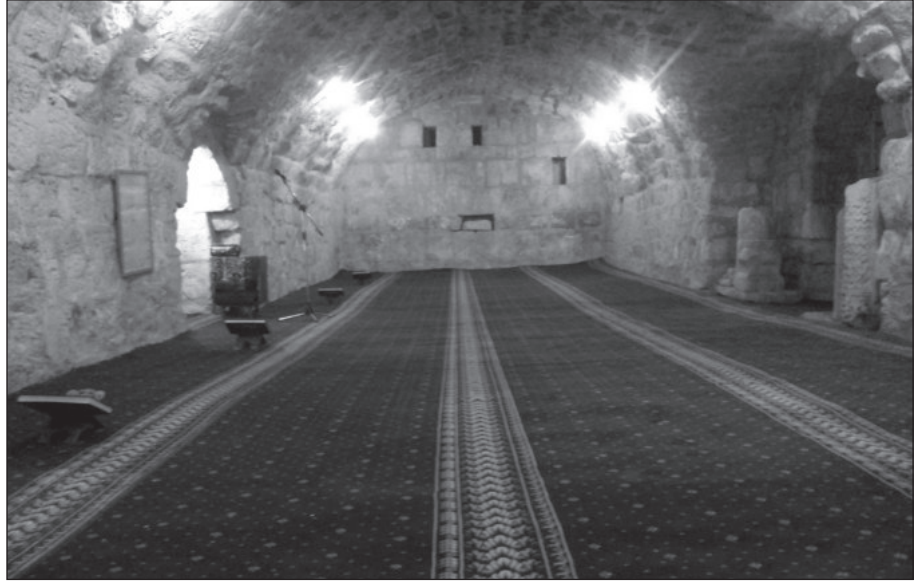
١٨. المسجد من الداخل بعد الترميم.

لاش: أعمال الصيانة والترميم لمسجد القسطل الأثري