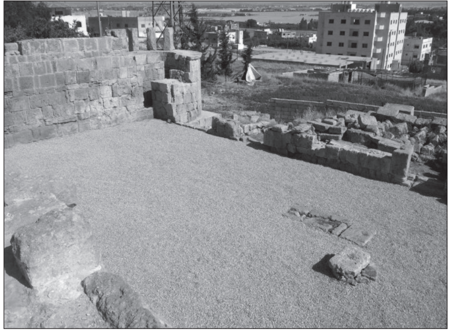
١٢. ساحة المسجد بعد فرشها بالصحى.

وموازنة باقي أجزاء الجدار (الشكلين ١٣، ١٤). والجدير بالذكر أنه من المرجح أن المدخلين الواقعين في الجهة الشمالية قد استحدثا في فترة لاحقة وعلى الأغلب خلال الفترة الأيوبية المملوكية نظراً لتساوي عتباتهما مع مستوى الأرضية الحالية للساحة وعثورنا على كسر من الفخار الأيوبي المملوكي بين مداميك ذلك الجدار خلال عملية التنظيف، في حين يظهر مدخل آخر بعرض (٩٣سم) يتوسط هذين المدخلين