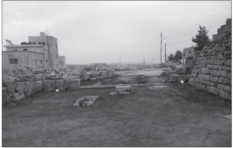
١٥. جدار الساحة الشرقي قبل الترميم.