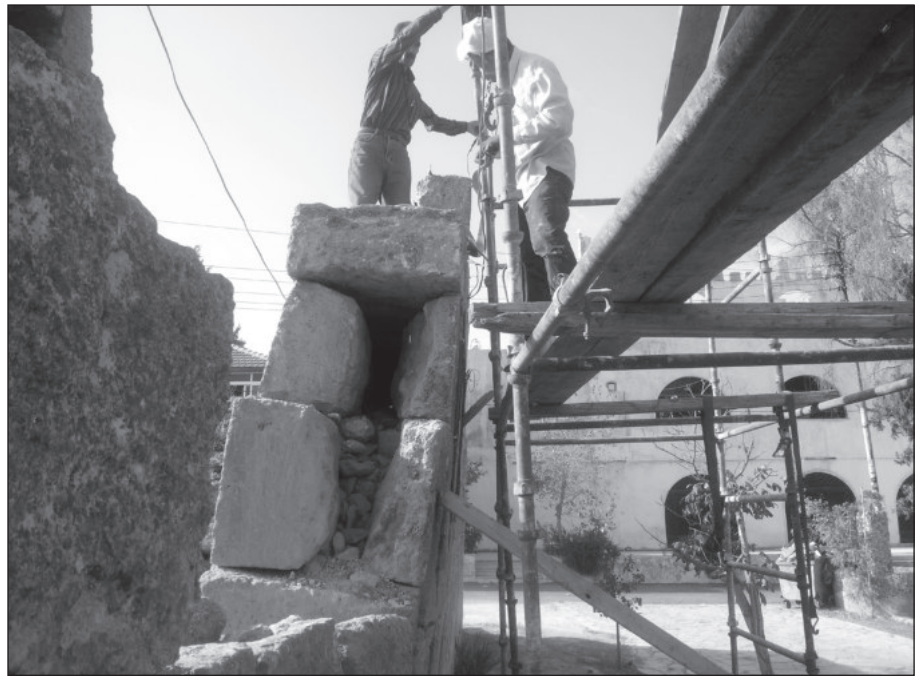
٥. عدم وجود المادة الرابطة بين حجارة الجدار.

الذي كان عليه، كما لا يوجد خلاف على عدم استخدام أي مواد حديثة خلال عملية الترميم والإقتصار على استخدام نفس المادة الرابطة التي كانت مستخدمة عند بناء الجدار في المرحلة الأموية، وهي الرمل والجير وحببيات الحصى الصغيرة (رمل السيل)، إلا أن التحدي الأكبر يظهر عند العلم بأن هذا المسجد الذي بني في الفترة الأموية وتم استخدامه وأعيد بناء أجزاء منه في الفترة الأيوبية والمملوكية والعثمانية وحتى في