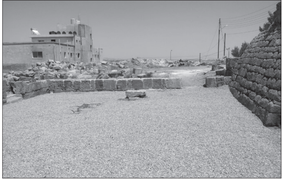
١٦. جدار الساحة الشرقي بعد الترميم.