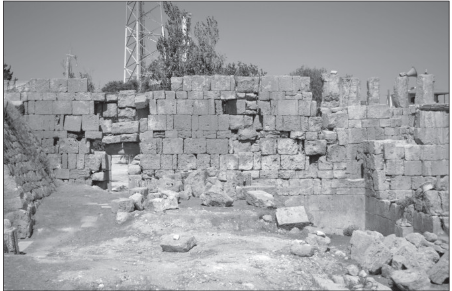
١٠. الجدار الغربي من الداخل قبل الترميم.

وبعد الإنتهاء من إعادة بناء الجزء الجنوبي من الجدار الغربي كان لابد من معالجة الجزء الشمالي منه وبالذات الوجه الداخلي حيث يتضح فقدان بعض الحجارة بالإضافة إلى فقدان مساحة كبيرة من حجارة الوجه الداخلي يعرض يتراوح من (١٠٠ إلى ١٦٢ سم) وارتفاع (٢,٥٨م)، (الشكل ١٠) والتي كانت تشكل خطورة تهدد بانهايار جزء كبير من الجدار في حال تركها على هذه الحال، وعليه فقد تم إعادة بناء ما هو مفقود من حجارة في ذلك الجزء من الجدار كما هو واضح في (الشكل ١١).