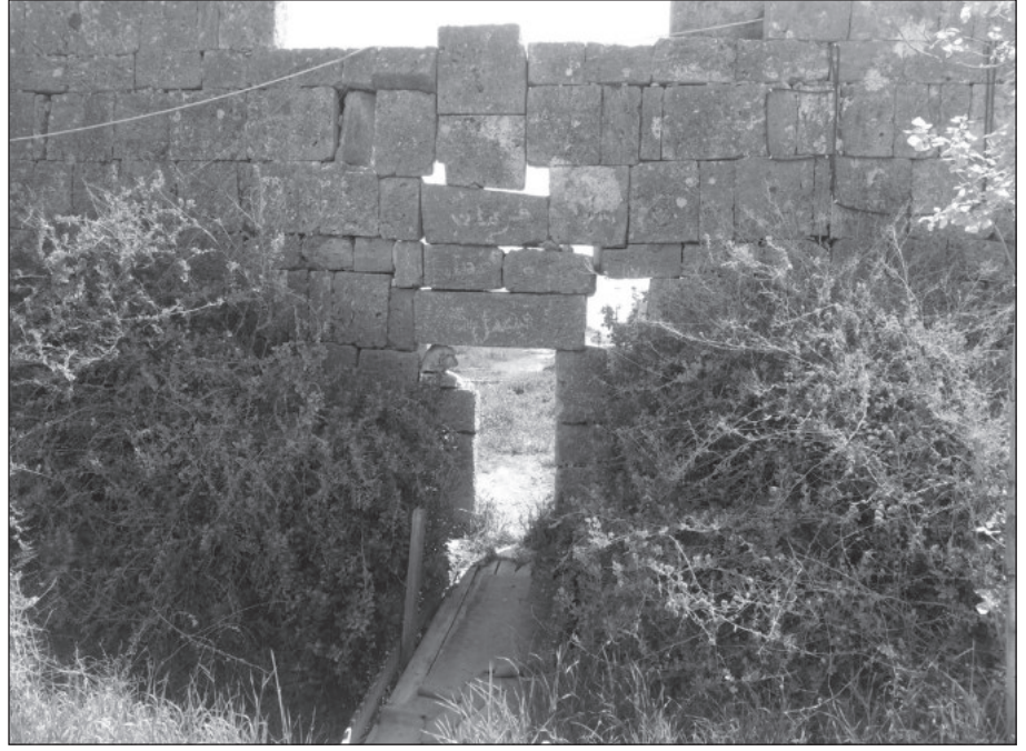
٢. مدخل الجدار الغربي من الخارج قبل الترميم.