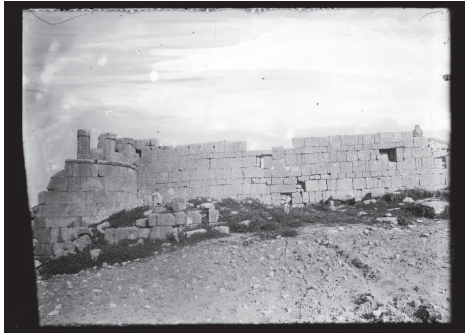
٦. الصورة التي التقطها الأباء الدومنيكان للجدار.