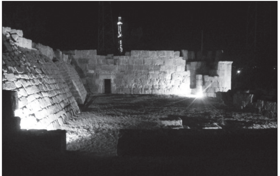
٢٠. انارة الساحة الخارجية للمسجد.