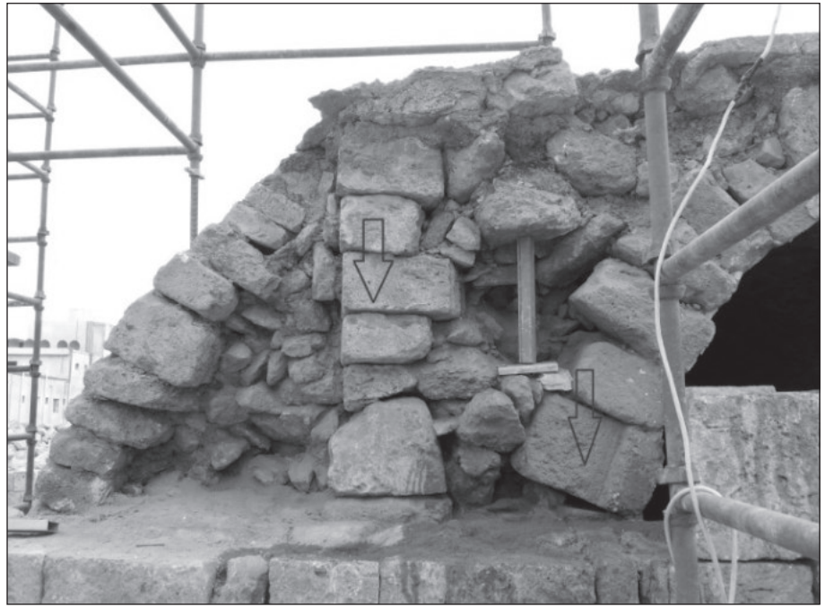
٢٢. استخدام حجارة عشوائية في بناء جزء من الجدار الشمالي والسقف البرميلي.

مثلثاً تلتقي رؤوسها عند النقطة التي كان مثبتاً بها القضيب المعدني الذي يمتد ظله عليها لتحديد الساعة، وما زالت بقايا ذلك القضيب موجودة في تلك النقطة، أما قاعدة المثلثات والتي تشير كل واحدة منها لساعة من ساعات النهار فكل قاعدة من قواعد تلك المثلثات مقسومة أيضاً إلى نصفين بحيث تقوم هذه المزولة من خلال ظل القضيب المعدني المنعكس عليها بإعطاء التوقيت لأقرب نصف ساعة من ساعات النهار، هذا