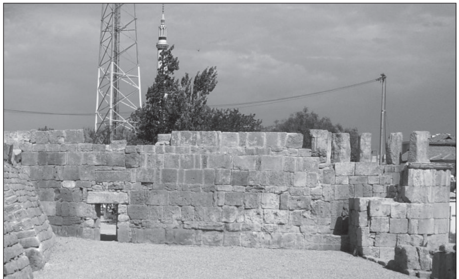
١١. الجدار الغربي من الداخل بعد الترميم.