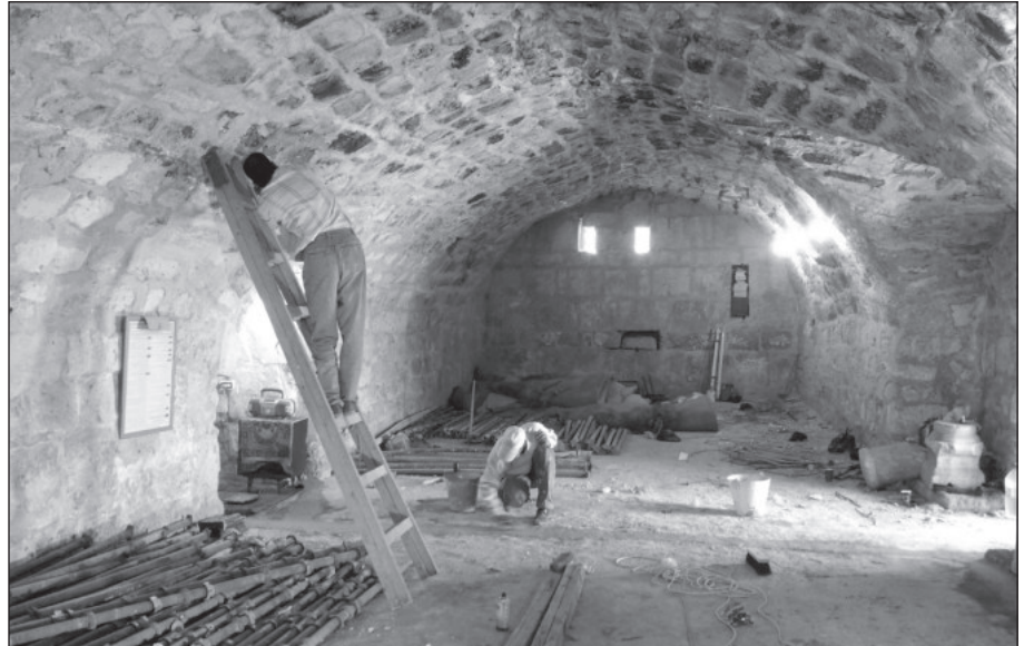
١٧. المسجد من الداخل قبل الترميم.