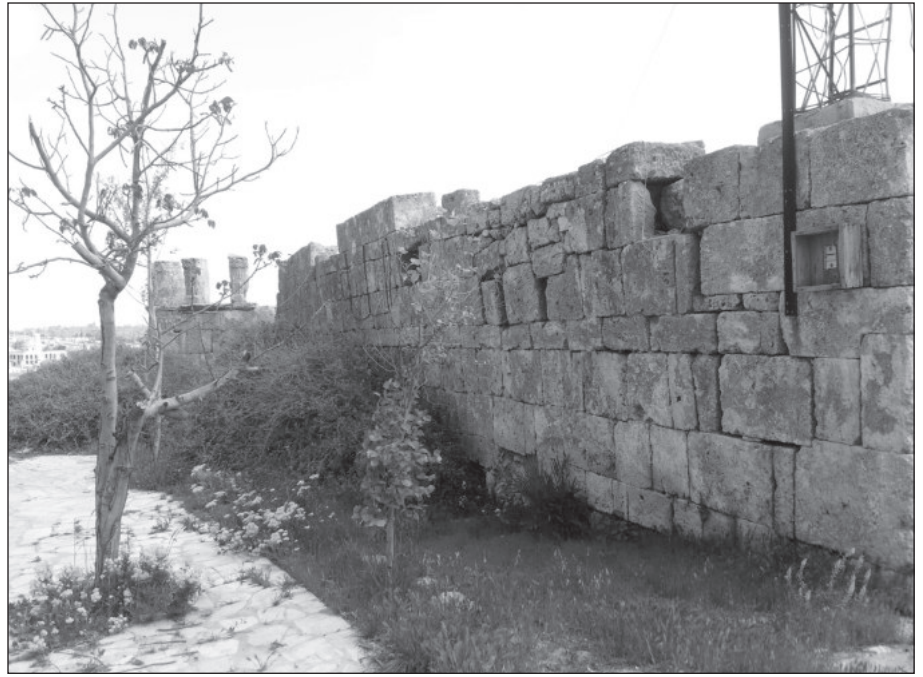
٣. الجدار الغربي قبل إزالة الأشجار والنباتات.

المستندة على بعضها بطريقة خطيرة جداً شكّلت خطورة بالغة عند القيام بأي تدخّل في ذلك الجدار كما يتضح من (الشكلين ٤، ٥) ، وأمام ذلك الوضع البالغ الخطورة كان الحل الوحيد المُتاح هو فك الجزء الأكثر خطورة في الجدار و البالغ طوله (١٢,٦١م) وإعادة بناء الأساس المفقود بطول (١٩,١٤م) وذلك باستخدام نفس الحجارة وإعادة كل حجر لموقعه الأصلي واستبدال التالف منها وملئ الفراغات الناتجة