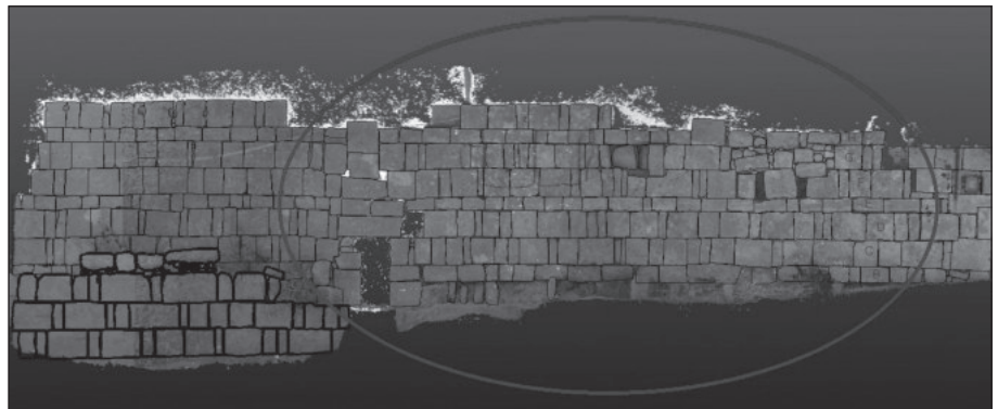
٧. مخطط ١.