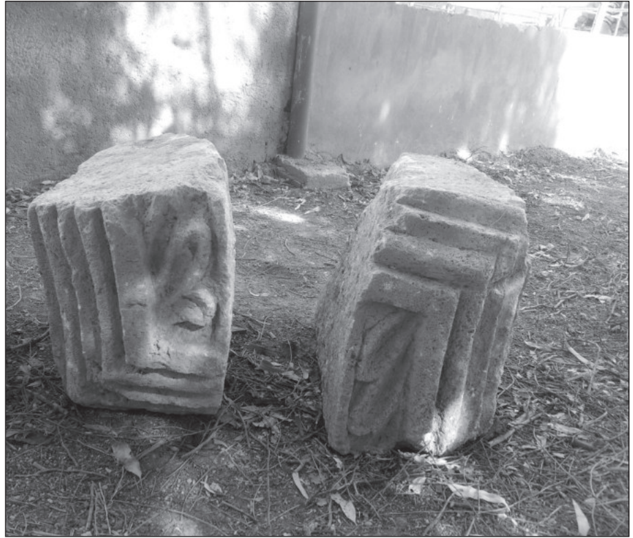
٢٣. حجري القوس غير المتجانسين.

اشتملت أيضاً على إعادة بناء الزاوية الجنوبية الشرقية للمسجد من الخارج، فبالرغم مما شكله استخدام مادة الإسمنت من تماسك لأجزاء البناء إلا أن عملية إزالته حالياً تشكل عملاً بالغ الصعوبة و يتطلب وقتاً وجهداً كبيراً لا يقل عن سنة من العمل المتواصل، ولذلك فقد اكتفينا خلال هذا الموسم بإزالة ما هو موجود