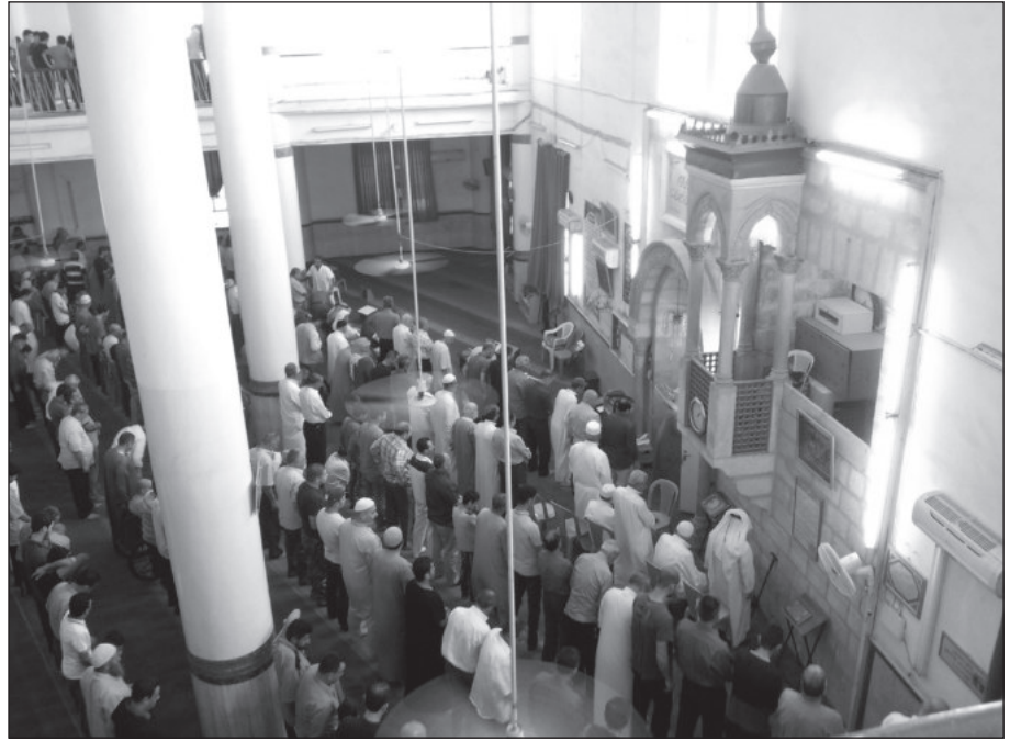
٢٦. قبلة مسجد ابو بكر الصديق.

الباحثان)، فكان يكفي الاتجاه جنوباً عند الشروع في الصلاة وعليه كان يُحدد اتجاه المحراب عند بناء المساجد. وبعد اختراع أجهزة المساحة الدقيقة والتي يمكن من خلالها تحديد اتجاه بيت الله الحرام في مكة المكرمة بالنسبة للمنطقة التي يكون الشخص متواجداً فيها، فقد تم ملاحظة أن كثيراً من المساجد ومنها ما بُني في القرن العشرين قد تم بناؤها باتجاه ينحرف عن اتجاه القبلة، ولدينا في مسجد أبو بكر الصديق والمعروف بإسم مسجد الشيشان في مدينة الزرقاء والذي بُني في بدايات القرن العشرين خير مثال على ذلك، حيث قامت وزارة الأوقاف قبل ما يقرب من أربع سنوات بتعديل اتجاه القبلة فيه بعدما تبين من خلال أجهزة المساحة الحديثة انحرافها إلى الغرب عن اتجاه مكة المكرمة (الشكل ٢٦) وكذلك الأمر بالنسبة لمسجد عمر بن الخطاب في الزرقاء الذي بني في النصف الأول من القرن العشرين والكثير من المساجد الأخرى في المملكة، فإذا كان هذا هو الحال بالنسبة للمساجد فمن الطبيعي أيضاً أن نشاهد الانحراف في اتجاه بعض القبور إذا أردنا استخدام أجهزة المساحة الحديثة عند تحديد اتجاهها.