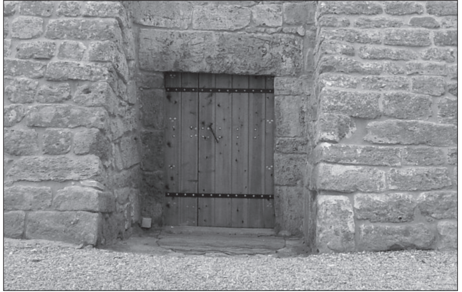
١٩. الباب الخشبي الذي تم تفصيله للمسجد.