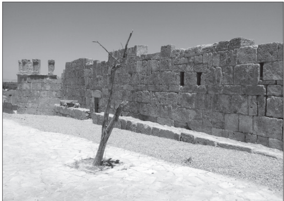
٩. الجدار الغربي بعد الترميم.

لقد شكّلت الدعامية الحجرية التي بنيت في الفترة الأيوبية المملوكية أمام الجدار الشمالي للمسجد