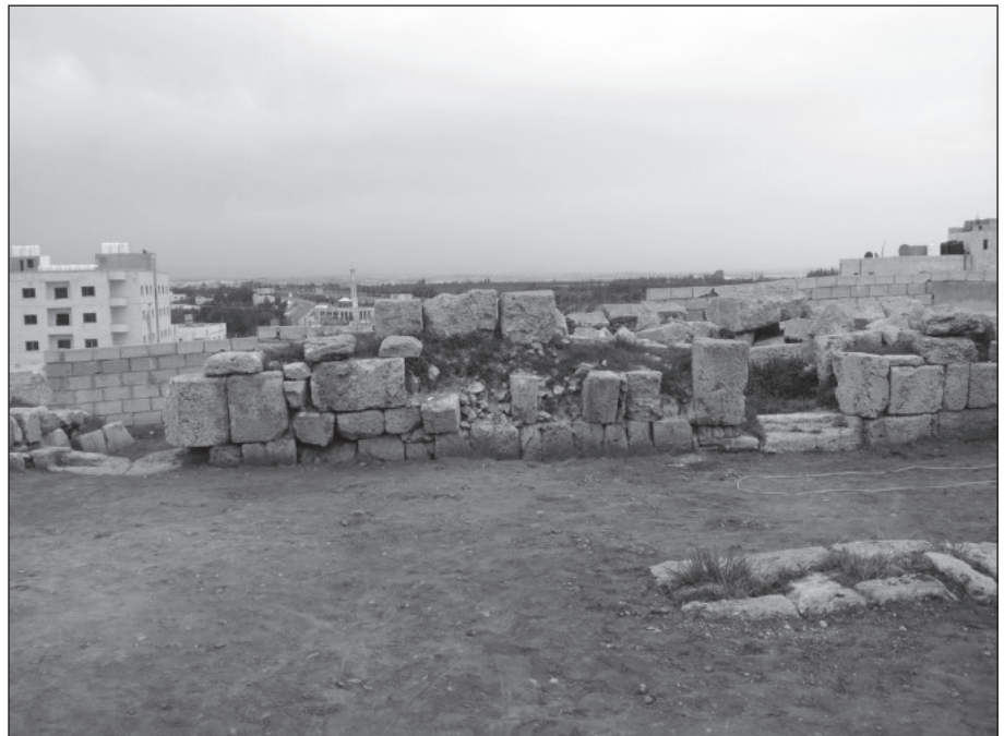
١٣. جدار الساحة الشمالي قبل الترميم.

والترميم هو ترميم الجدار الشمالي للساحة وبالأخص الجزء الواقع بين المدخلين الشماليين والذي يظهر منه على مستوى سطح الأرض مدمكين من الحجارة ويمتدان بطول (٧٢,٥م) وبارتفاع يتراوح من (٨٤-٨٩سم)، حيث يظهر في هذا الجزء من الجدار اندفاع واضح نحو الجنوب وفقدان لخمس حجارة من حجارة المدمك الثاني فتم العمل على تعديل حجارة المدمك الأول و تركيب خمسة حجارة مكان الحجارة المفقودة