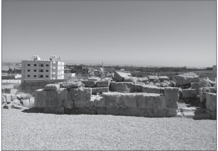
١٤. جدار الساحة الشمالي بعد الترميم.

مدماك واحد ارتفاعه (٥٣سم) وعرضه (٦٦سم)، بحيث يشكل هذا الجزء من الجدار مدخلاً واضحاً لساحة المسجد من الجهة الشرقية ويشكل ذلك الجدار مانعاً للسيارات والآليات للدخول إلى ساحة المسجد، دون إحداث تدخل ملحوظ في المظاهر المعمارية لهذا الجدار. (الشكلين ١٥، ١٦).