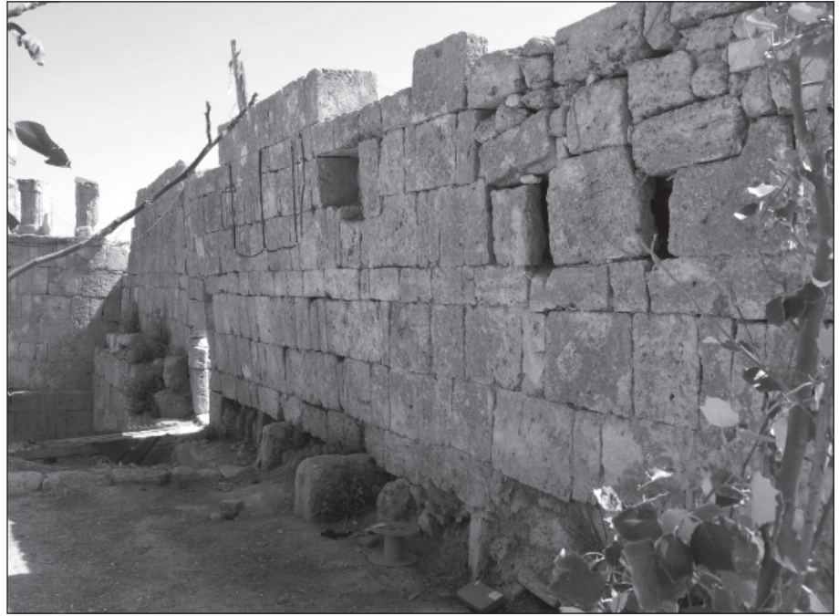
٤. الجدار الغربي بعد إزالة الأشجار والنباتات.