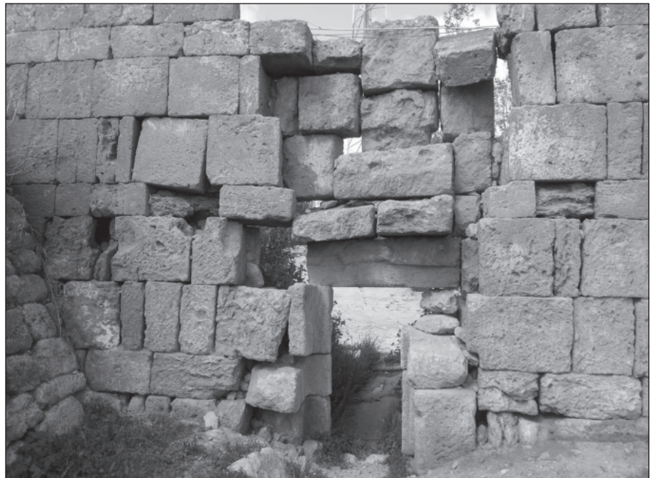
١. مدخل الجدار الغربي من الداخل قبل الترميم.