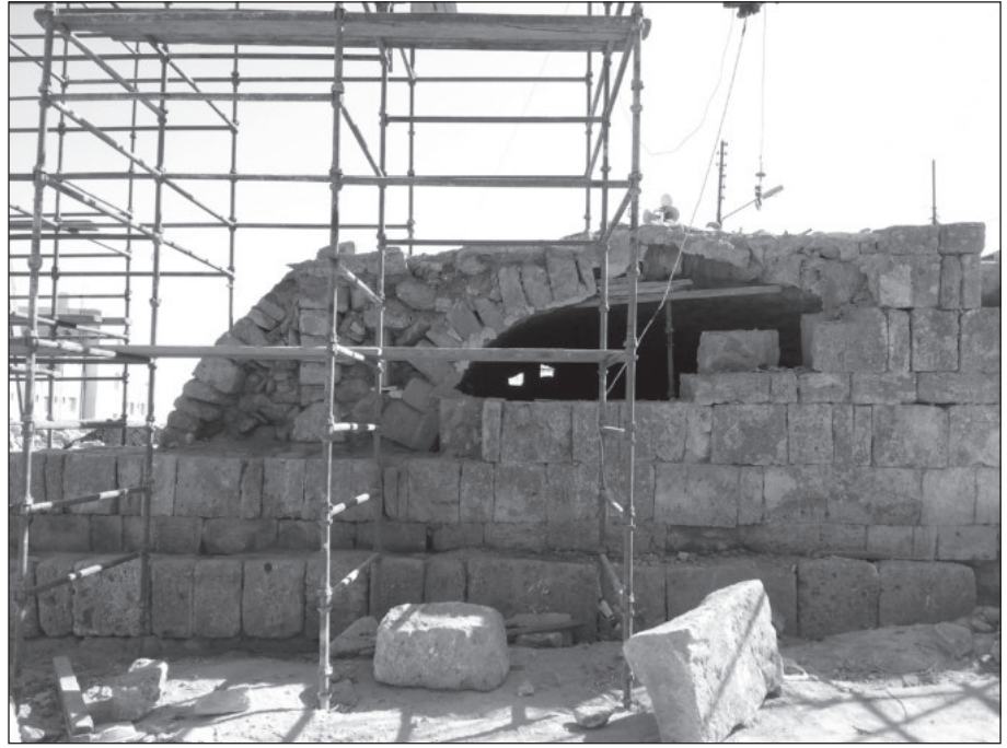
٢١. السقف نصف البرميلي والدعامية.